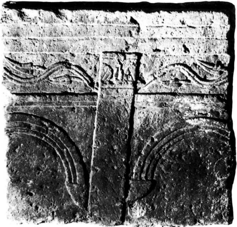
Fig. 3 - Cittanova, Lapidarium: frammento di sarcofago in calcare di Aurisina (sec. V).

Callisto, anche se a Cittanova il linguaggio aulico della capitale si abbassa alle forme del sermo rusticus di provincia. 34