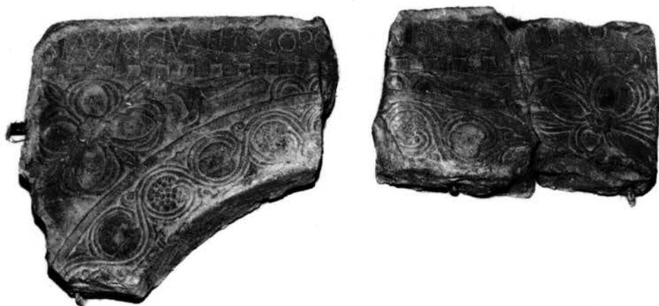
Fig. 6 - Cittanova, Lapidarium: archetto n. 3 del ciborio del vescovo Maurizio (sec. VIII).

ne di sede: si tratta dunque di provare se il Maurizio che ha costruito il ciborio di Cittanova sia lo stesso episcopus Histriensis di cui parla papa Adriano. 35