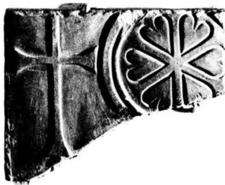
Fig. 2 - Lapidarium: frammenti di pluteo marmoreo.

la metà del sec. VI, è un frammento marmoreo (m. 0,49 x 0,59 x 0,08) del tutto simile ai plutei parentini col monogramma di Cristo in un clipeo circondato da lemnischi sorreggenti la croce a estremità patenti. 31 A questi vale la pena aggiungere un frammento di fianco di sarcofago (cm. 72 x 68 x 11,5) in calcare di Aurisina (fig. 3), quasi uguale a quello strigilato con croce monogrammatica di Aquileia datato al pieno sec. V. 32 Il nostro frammento, concluso da una cornice modanata a tre risalti, presenta una faccia che doveva articolarsi in pannelli divisi da pilastri: quello superstite è liscio e coronato da un capitello con tre foglie lanceolate e con una rosetta sull'abaco; dai lati del pilastro, partono due archi a triplice ghiera, nascenti da mensole e sormontati da un fregio a tralci e a foglioline cuoriformi delimitato inferiormente da due listelli.