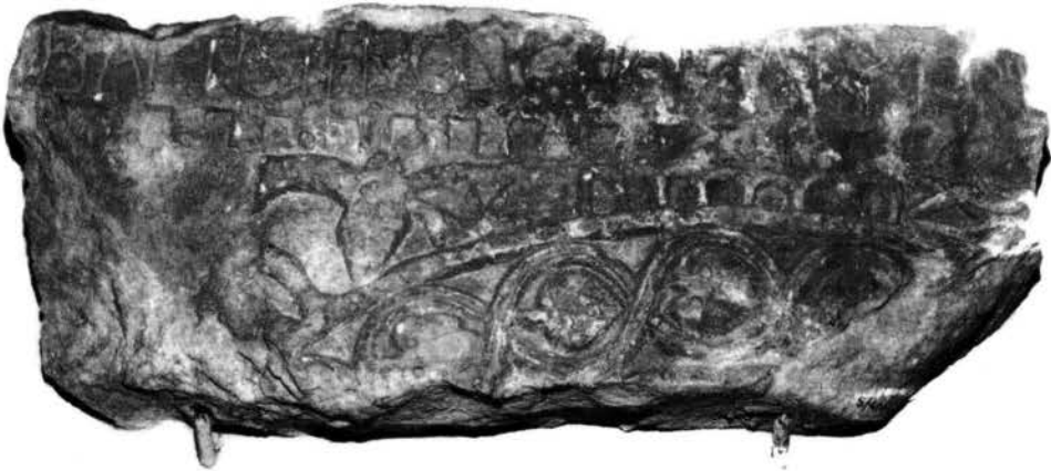
Fig. 5 - Cittanova, Lapidarium: archetto n. 2 del ciborio del vescovo Maurizio (sec. VIII).