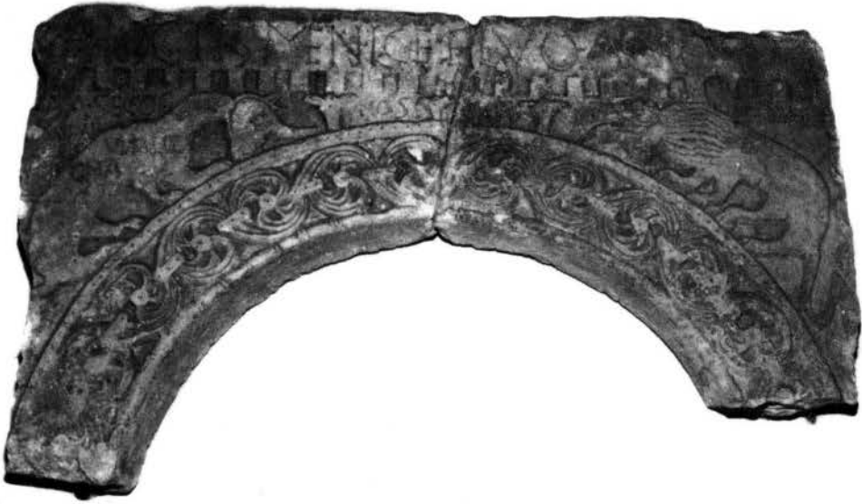
Fig. 4 - Cittanova, Lapidarium: archetto n. 1 del ciborio del vescovo Maurizio (sec. VIII).