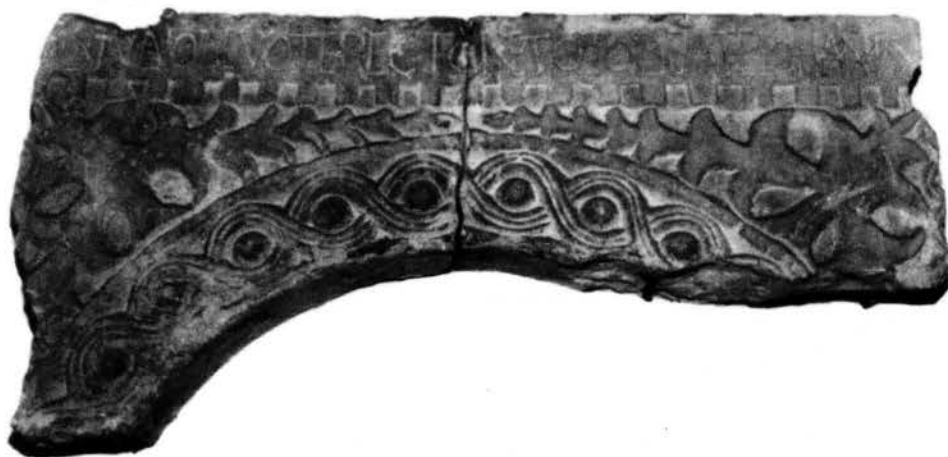
Fig. 7 - Cittanova, Lapidarium: archetto n. 4 del ciborio del vescovo Maurizio (sec. VIII).

giunto da vostra eccellenza di riscuotere le rendite del beato Pietro esistenti nel territorio più su ricordato e di mandarle a noi —, come, dicevamo, tanto i predetti Greci quanto alcuni Istriani, mossi da rabbia, gli strapparono gli occhi, rinfacciandogli l'intenzione di aver voluto consegnare lo stesso territorio istriano alla vostra sublime eccellenza.