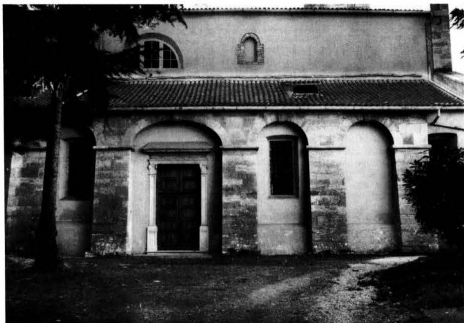
Fig. 1 - Cittanova, Duomo: una delle monofore paleocristiane emerse sul fianco settentrionale della navata maggiore.

Più sicuri punti di riferimento sulla prima organizzazione ecclesiastica di Cittanova d'Istria possono venir forniti invece dai riscontri archeologici, destinati come sempre a far luce nelle questioni più intricate. Così le quattro monofore solo recentemente apparse sul lato settentrionale della navata maggiore del Duomo di Cittanova richiamano l'attenzione sullo stadio più antico di