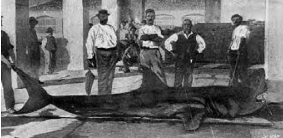
Foto ritoccata di uno squalo bianco esposto a Fiume dalla monografia "Fiume és a Magyar-Horváth tengerpart (1896)"