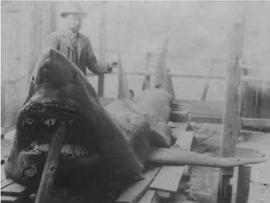
Squalo bianco catturato il 21 Maggio 1903 a Segna

retta condotta sulla base della dentatura dello squalo. Col tempo l'affidabilità delle perizie ufficiali atte a determinare la specie degli squali catturati aumentò sensibilmente. A partire del 1880 fino al 1890 l'autorità marittima iniziò ad affidarsi alle perizie del prof. Paolo Matkovich, "Prof. di scienze naturali e direttore della r.u. Accademia di Commercio". Matkovich non era un biologo e diversi esemplari che lui attribuì alla specie appaiono il frutto di un'identificazione errata, forse spiegabile con il desiderio di aiutare i pescatori visto che le autorità pagavano un premio solo per la cattura di squalo bianco. La misura era mirata a cacciare una specie che si sapeva estremamente pericolosa per l'uomo tanto da meritarsi l'appellativo di "mostro marino". Di fatto la popolazione locale non distingueva tra le tre specie di lamnidi tutte chiamate "Cagnizza" o "Cagnia", in croato "Psina" e pertanto esemplari giovani furono frequentemente confusi con le altre due specie di lamnidi presenti nell'Adriatico: l'Ossirina (Mako) e il ben più raro Smeriglio.