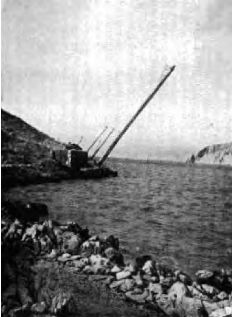
Tonnara di Lukovo Otočko