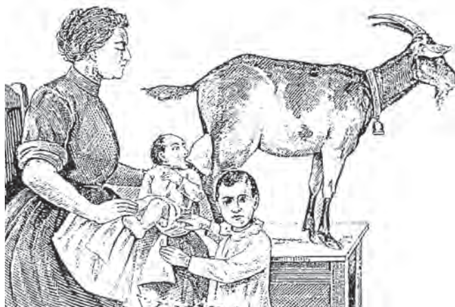
Fig. 4 - Latte di capra usato come surrogato nell'alimentazione del neonato

Ricorso di Margherita Morin, nullatenente: