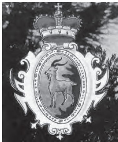
Fig. 1 - Il simbolo dell'Istria da una cartolina, ai tempi dell'Impero austro-ungarico