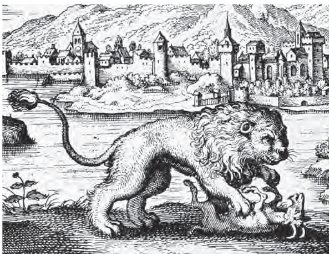
Fig. 2 - Particolare dell'incisione in rame "Parens, in Orient", dal Thesaurus Philopoliticus di Daniel Meissner, 1625-1627

far alcun danno. Pascolo che generalmente era limitato, con le capre tenute legate ad una fune, ed acconsentito solo dopo il levar del sole e prima del tramonto. Inevitabilmente questa politica restrittiva incontrò forti resistenze. Arrivò improvvisamente a mancare un importante nutrimento per le famiglie disagiate e nullatenenti che dipendevano dai beni comunali dove prima il pascolo era permesso. Di conseguenza le nuove disposizioni erano destinate immancabilmente a non essere osservate integralmente, il che portava a sua volta al pericolo della confisca dell'animale.