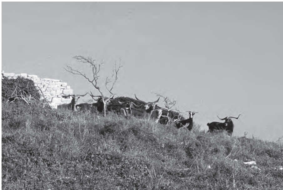
Fig. 3 - Capre allo stato brado su uno scoglio dell'arcipelago delle Brioni