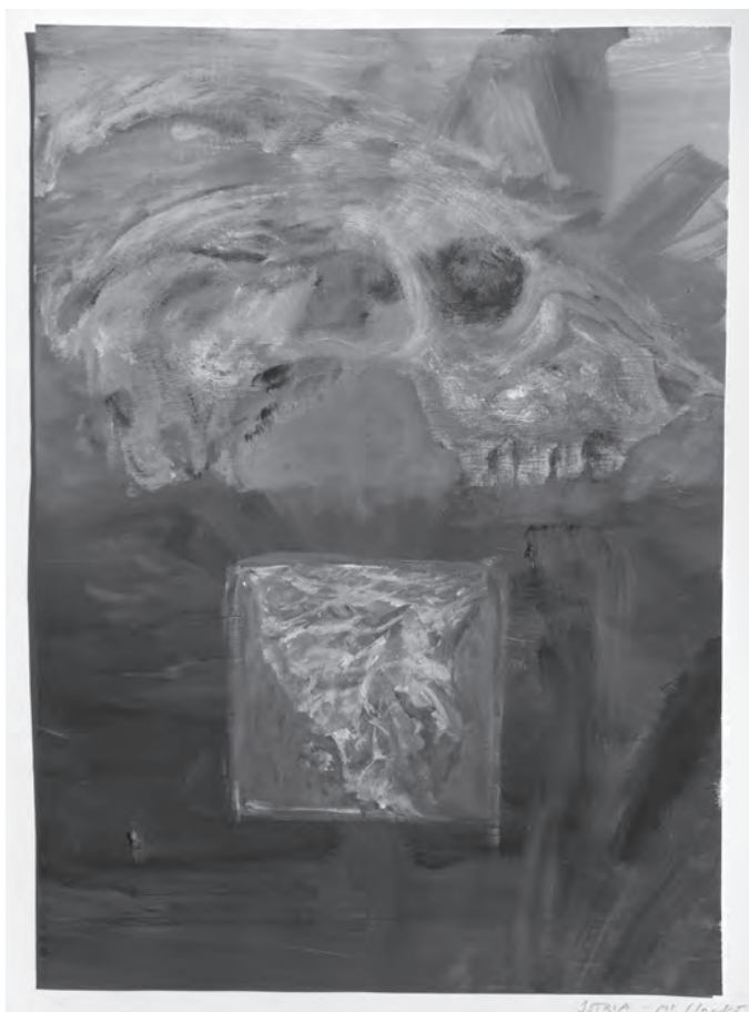
Fig. 7 - Mila Pericin (2013): La capra e l'Istria, acrilico

Concludendo possiamo dire che la capra in Istria, dopo aver subito per più di un secolo una specie di caccia alle streghe, sta ritrovando il suo giusto posto nella zootecnia locale. Non di meno aiutano a far ritornare l'antico interesse per la capra anche le fiere sulle piazze istriane, dove sempre più spesso sono offerti prodotti di capra, apprezzati per le loro indubbie qualità alimentari, ed in particolare la mostra caprina, che ogni anno si svolge nella più bella piazza dell'Istria, a Sanvincenti.