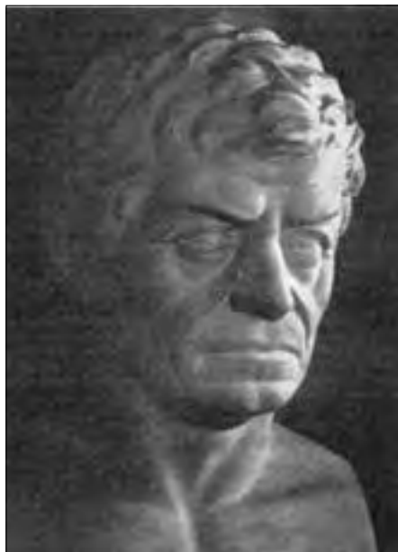
Fig. 1 - Busto di Bartolomeo Biasoletto nel Civico Museo di storia patria di Trieste (da “Pagine istriane”, n. 4, 1950, p. 199)

ca, domestica o rurale”. Fin dai tempi antichissimi l’uomo ha utilizzato per il cibo, i medicinali, i tessuti, gli utensili, gli attrezzi oltre a molti altri impieghi e oggetti di vario genere le piante dall’ambiente circostante.