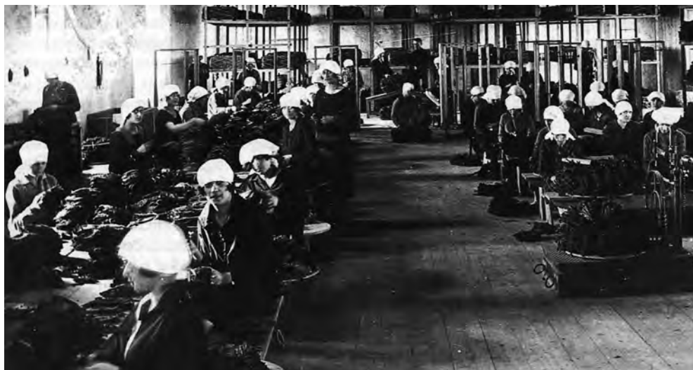
Operaie al lavoro presso la Manifattura tabacchi ( Rovigno d'Istria , vol. II, Famia Ruvignisa-Centro di Ricerche Storiche di Rovigno, Trieste, 1997, p. 422)