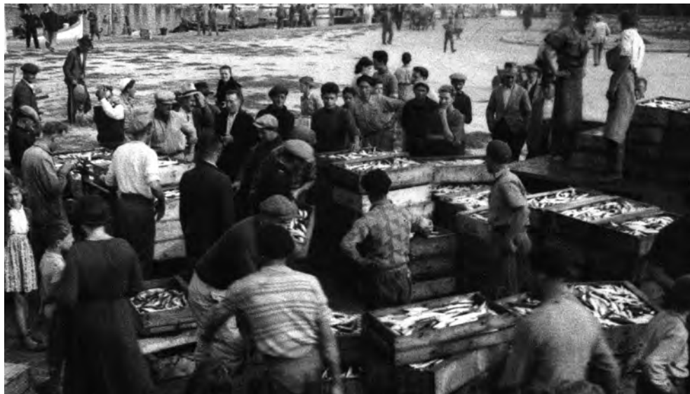
Compravendita di pesce

posita comprovante la legalità del prodotto. A distanza di un anno, secondo l'articolo 29, il vino e l'olio sarebbero stati nuovamente controllati e bollati in base alla quantità di liquido rimasto.