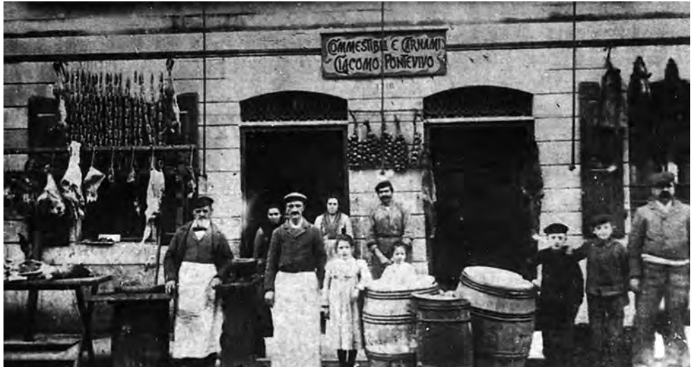
Macelleria Ponteviso (Rovigno d'Istria, vol. II, Famia Ruvignisa-Centro di Ricerche Storiche di Rovigno, Trieste, 1997, p. 422)